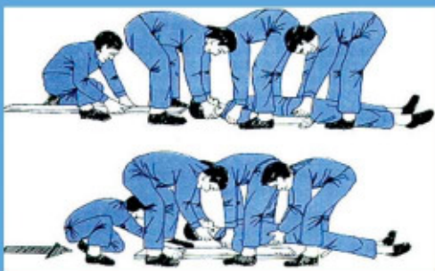
四人搬运法（跨下传递）