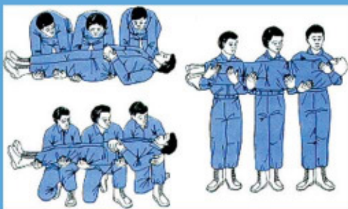
三人搬运法（举起和滚动）